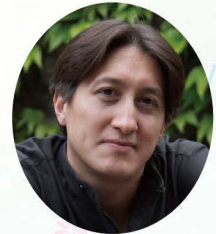
Freddy Kempf (Piano/UK)

オフィシャル・ウェブサイト https://www.freddy-kempf.com/